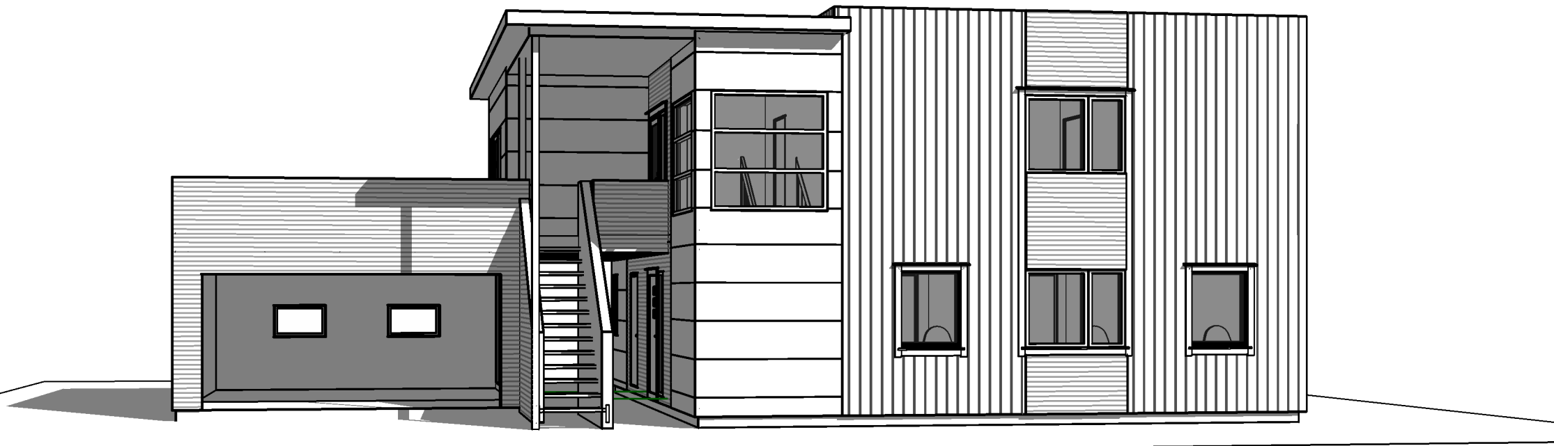
Perspektiv sett fra øst