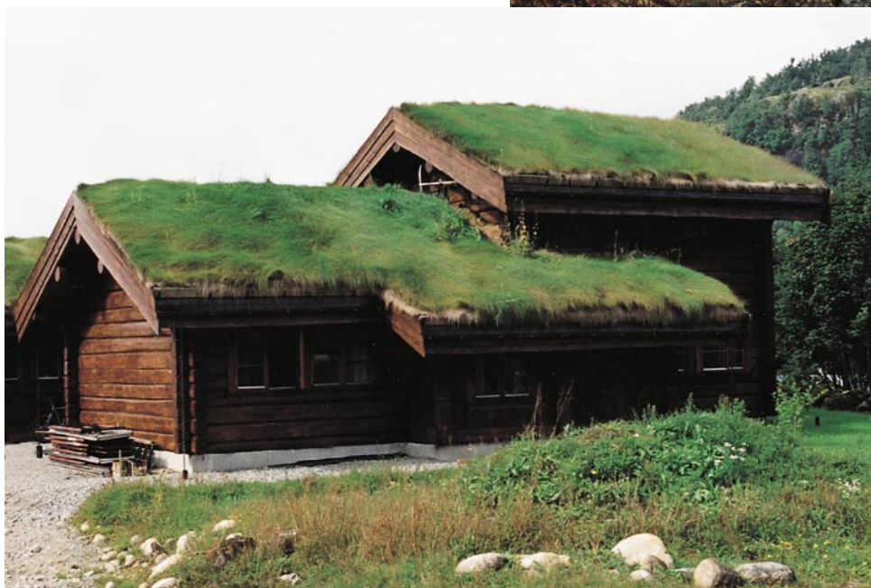
Ferdig lagt torv.