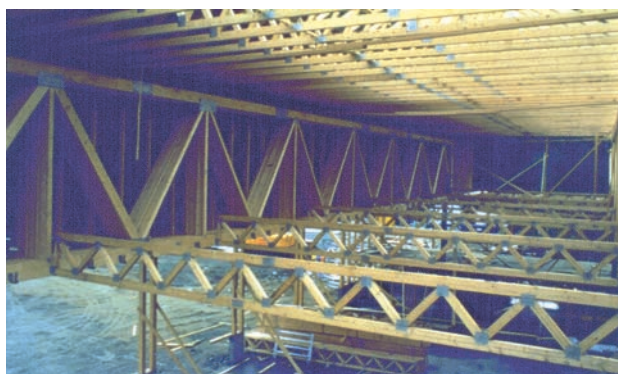
Figur 7.3 Eksempel 2: Hver drager består av 10 stk. gitterdragere med høyde 3 m. Leverandør: Naglestad Bruk AS.