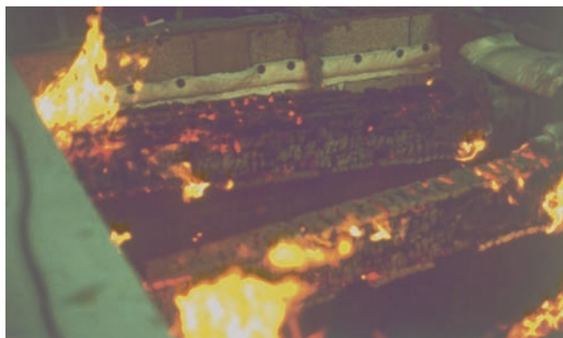
Figur 7.1 Ved å sette flere enkeltbærere inntil hverandre, og samtidig beskytte over- og undersiden med trebaserte plater, oppnås en effektiv isolering av spikerplatene, slik at temperaturene holder seg under 300 °C så lenge de trebaserte platene er intakte.

nen. Dette gjaldt opplysninger om temperaturer på spikerplater, tid til brudd og innbrenningsdybde.