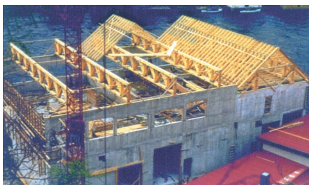
Figur 7.2 Eksempel 1: I den ferdig monterte seksjonen er bjelkelaget dimensjonert for bruk til kontor og velferdssrom. Leverandør: Naglestad Bruk AS.

I eksempel 2 (→ figur 7.3) er ti gitterdragere montert sammen. Takkonstruksjonen er bygget opp av gitterdragere, pulttakstoler og saltakstoler. Hovedbæringen er to gitterdragere med spennvidde 27 m.