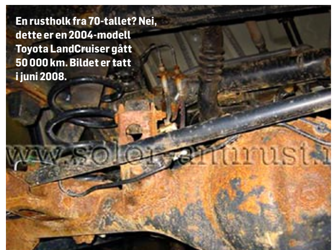
En rustholk fra 70-tallet? Nei, dette er en 2004-modell Toyota LandCruiser gått 50 000 km. Bildet er tatt i juni 2008.