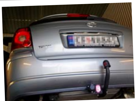
Etter kun fire måneder ble det oppdaget rust på denne 2009-modellen Toyota Avensis.

Dermed er det vel ingen flere tenkelige forhold Mitsubishi kan ta i tilfelle en Outlander skulle begynne å ruste. Dessverre er ikke dette tilfellet enestående, for en rekke bilprodusenter ramser opp flere tilsvarende forhold i sine garantibestemmelser.