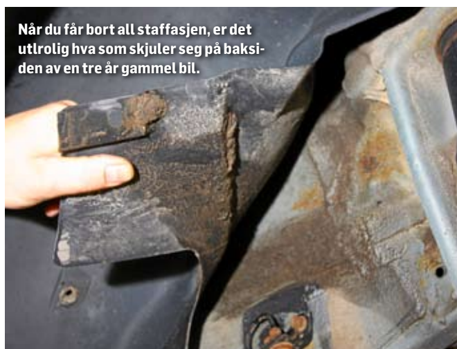
Når du får bort all staffasjen, er det utrolig hva som skjuler seg på baksiden av en tre år gammel bil.