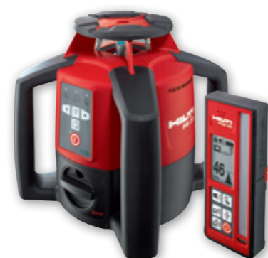
Hilti Roterende laser PR 35 Art. nr. 7426382