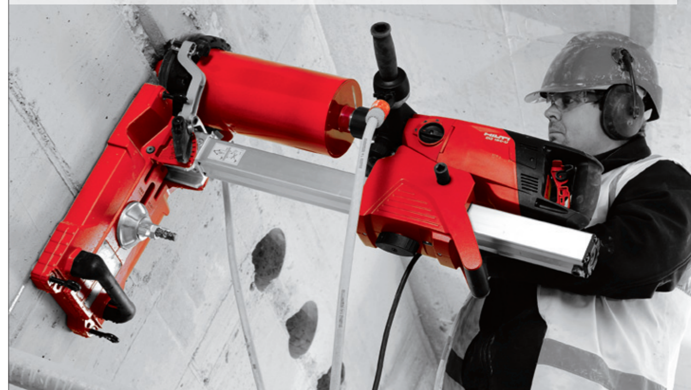
Hilti Kjernebormaskin DD150-U, Art. nr. 7433323* – pakketilbud! Borstativ DD 150-U, Art. nr. 7435666 Chuck Pixie, Art. nr. 72008134