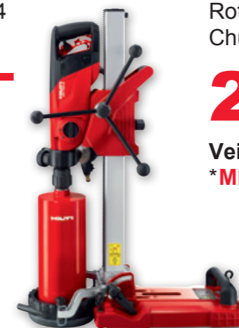
Hilti Kjernebormaskin DD160, Art. nr. 72005205* – pakketilbud! Borstativ, Art. nr. 7435663 Roterende søyle, Art. nr. 72006373 Chuck Pixie, Art. nr. 72008134

* 62% rabatt gjelder på bor og ikke maskinen.