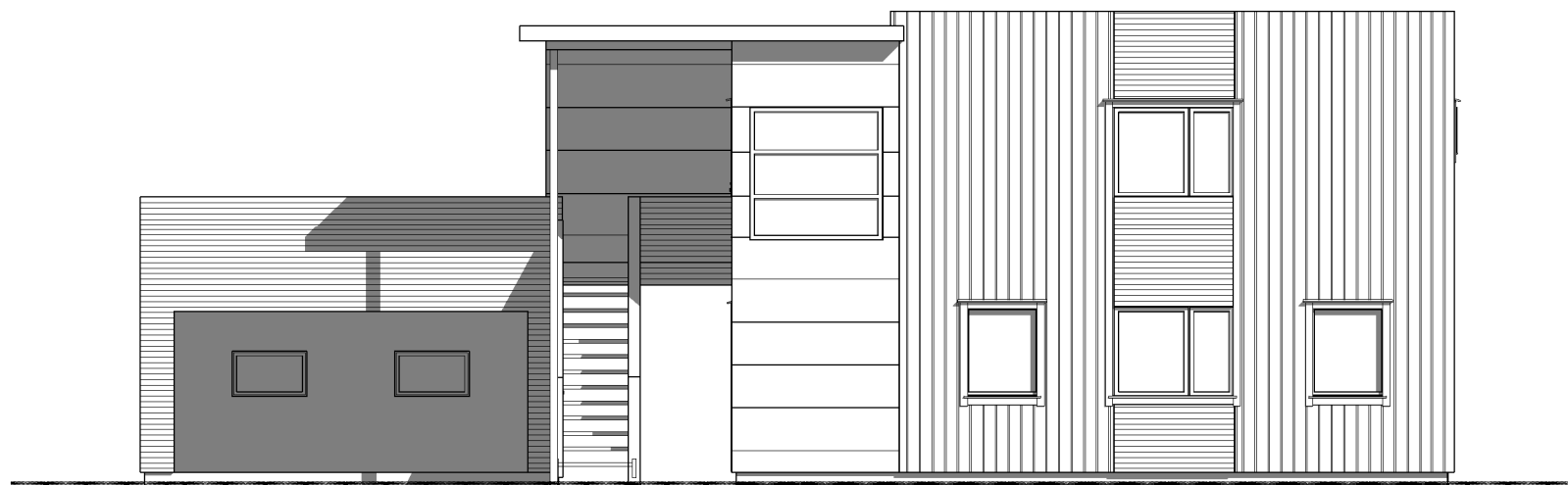
Fasade mot øst