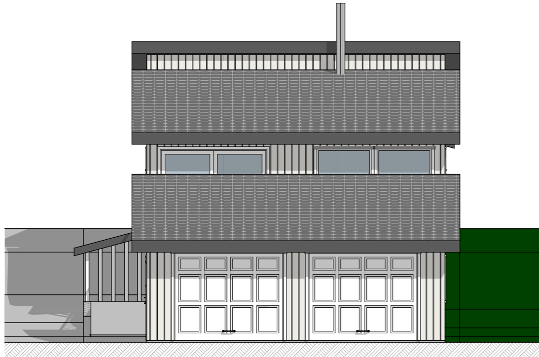
1:100 Fasade 1