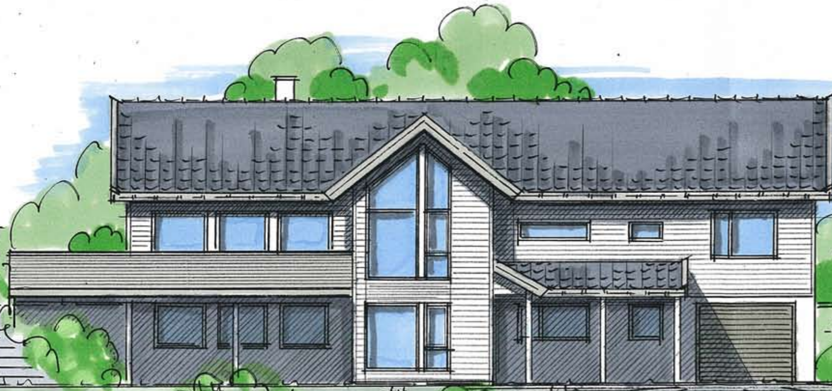
FASADE MOT SØR.