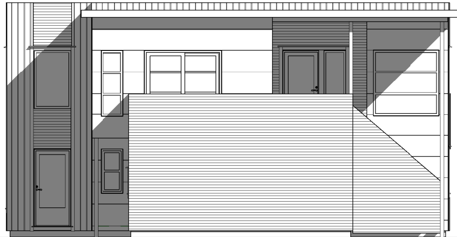
Fasade mot sør