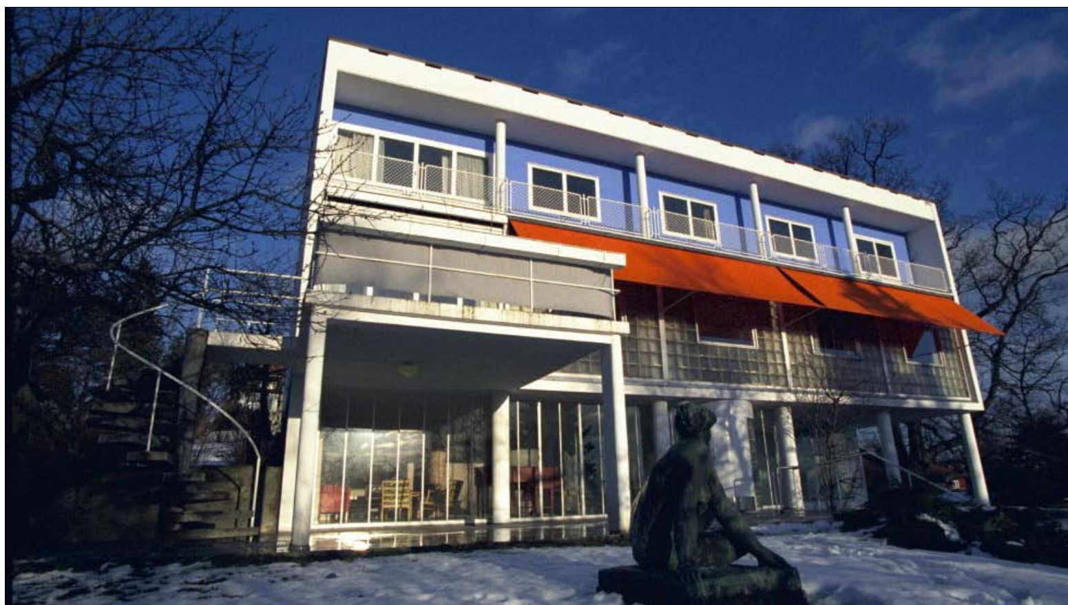
FUNKIS: Villa Stenersen fra 1937 er kanskje Oslos mest kjente funkisvilla. Noen funkisboom kom aldri til Norge, skriver Kjetil Rolness.