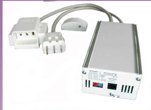
Komfyrvakt 1-fas modell 2 - 230V 25A,