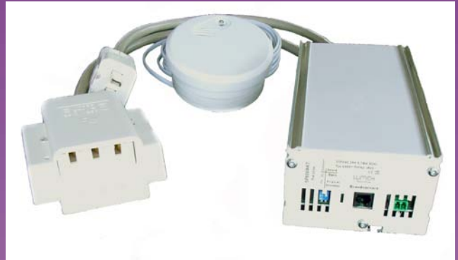
Komfyrvakt 1-fas modell 4 (Brandsäkert hem),