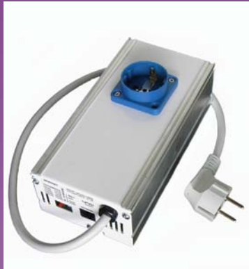
Komfyrvakt 1-fas modell 1 - 230V 16A,