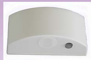
IR-Varmevakt med trykknapp,