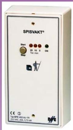
Komfyrvakt 1-fas + 3-fas,