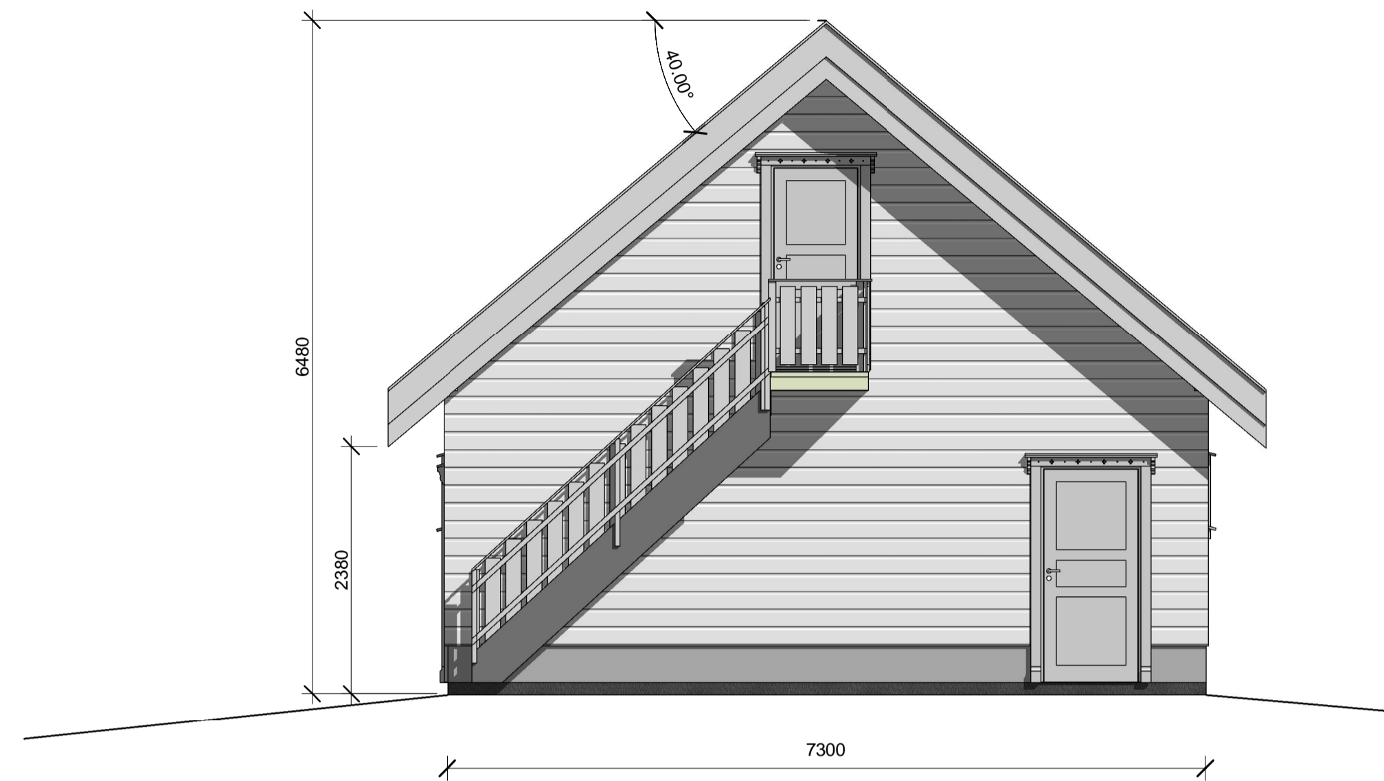
Fasade Sør-Vest 1 : 50