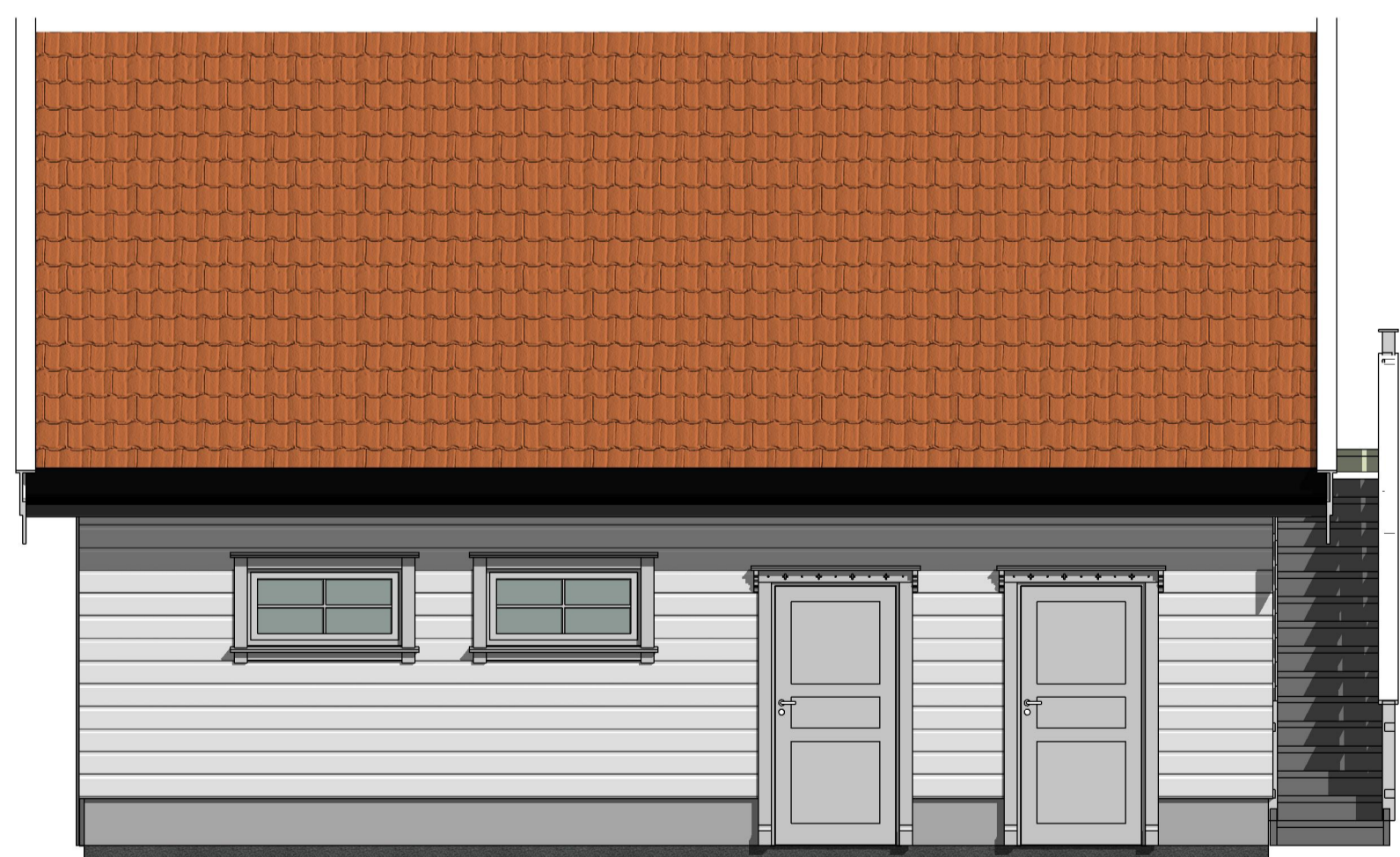
Fasade Nord-Vest 1 : 50