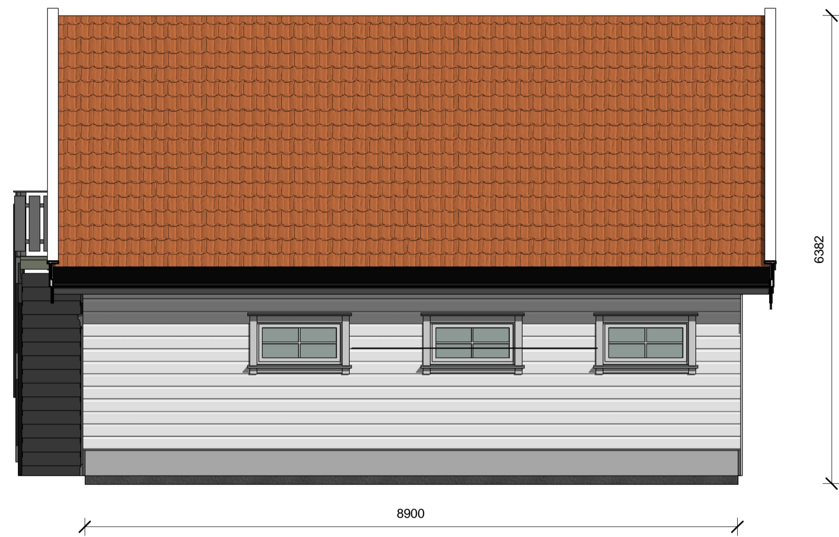
Fasade Sør-Øst 1 : 50