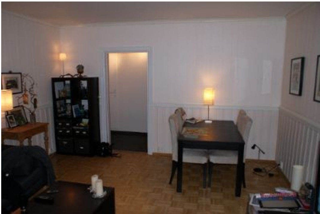
Illustrasjon 3: Stue - mot gang