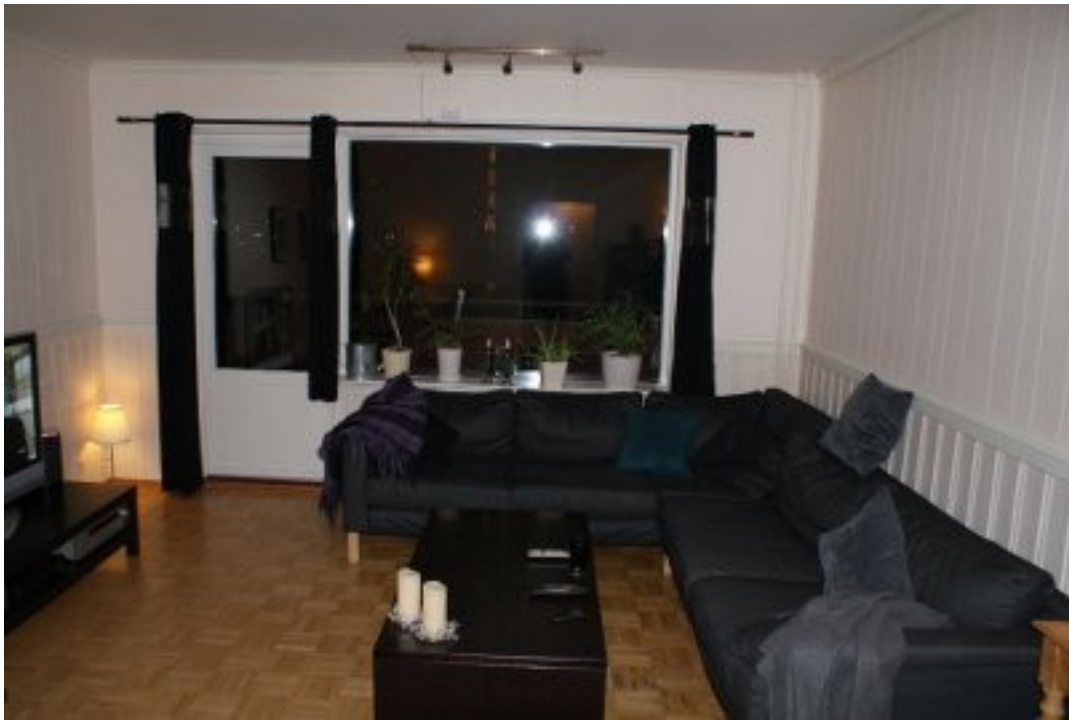
Illustrasjon 2: Stue - mot veranda