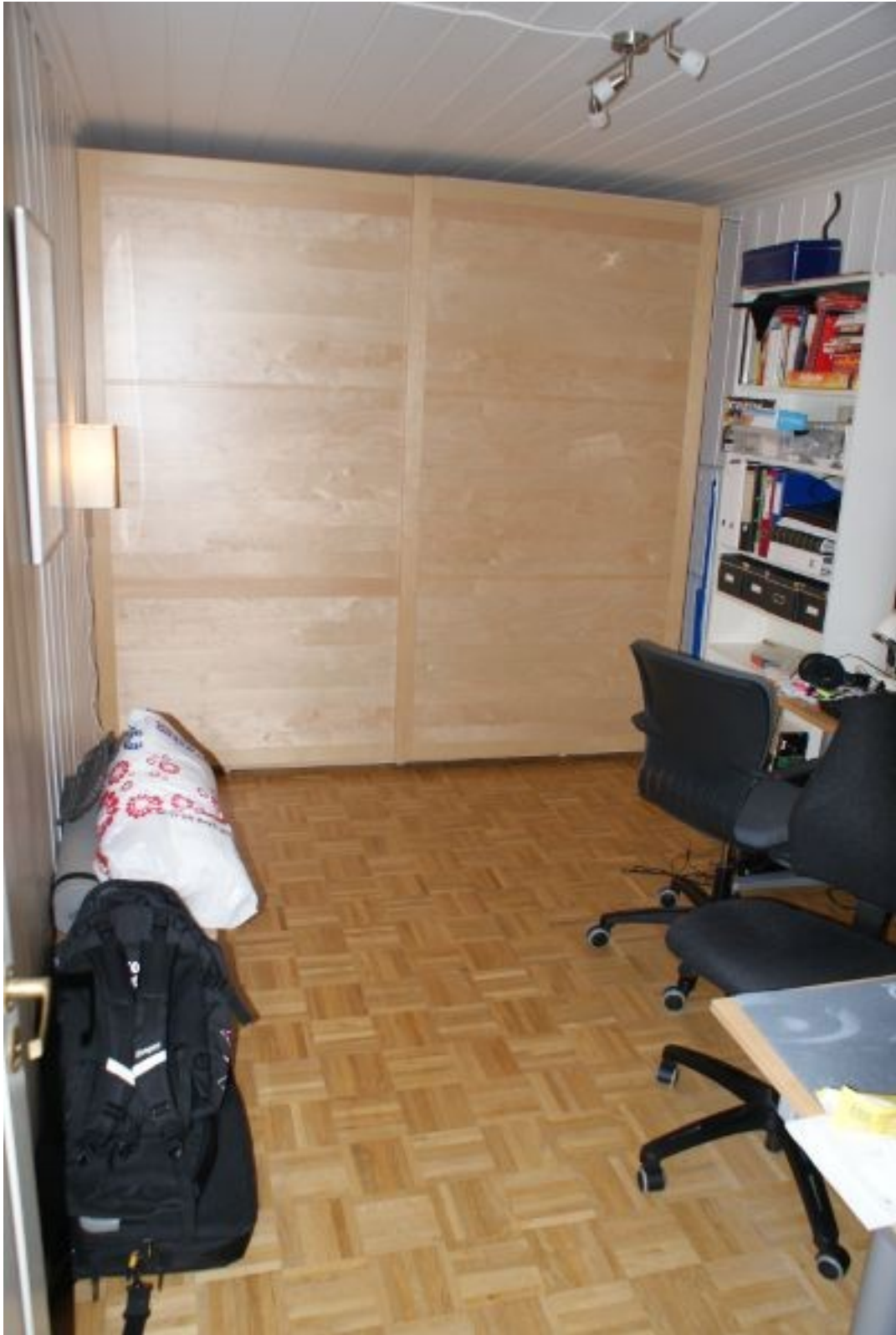
Illustrasjon 4: Kontor