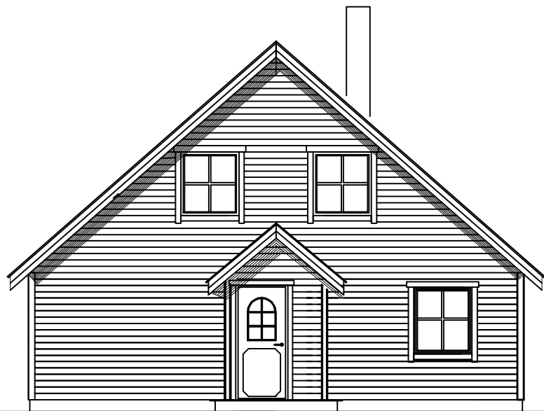
FASADE SYD ØST