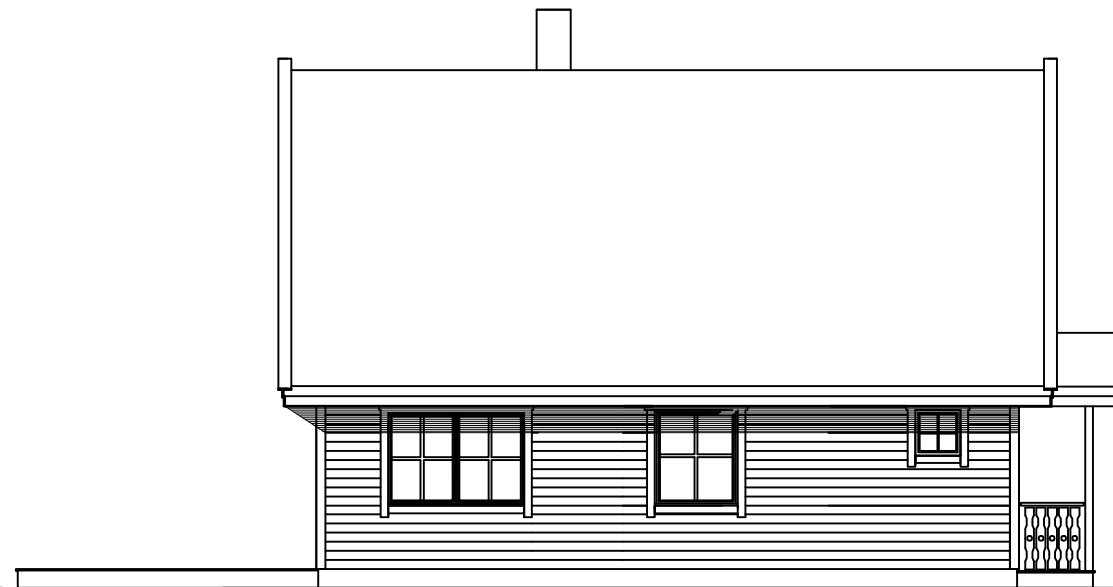
FASADE SYD VEST