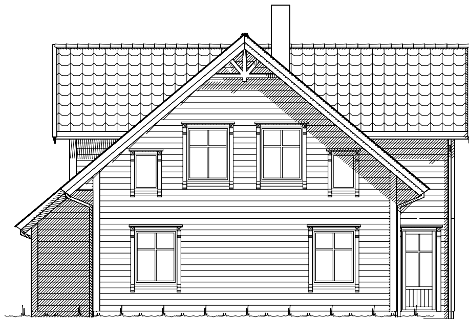
Fasade mot .

Ferdig planert terreng Bak / under terreng Eksisterende terreng