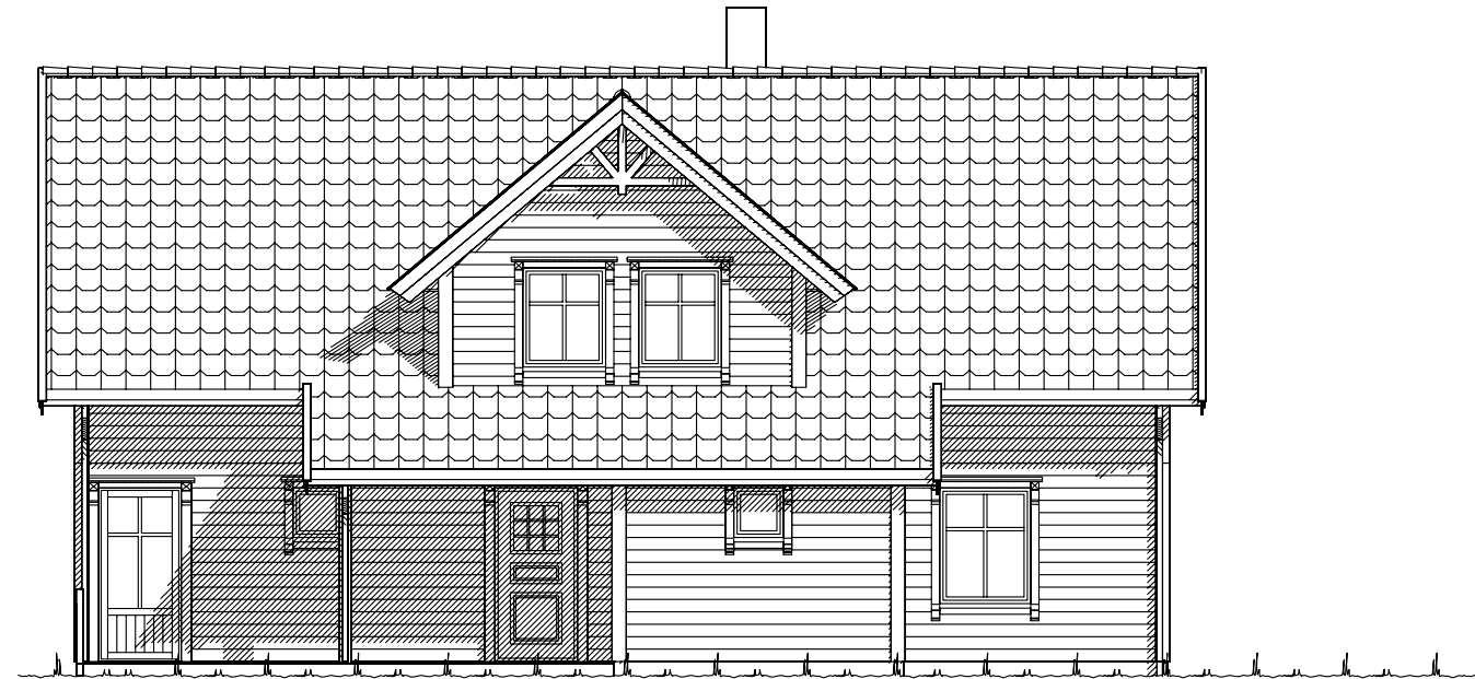
Fasade mot .