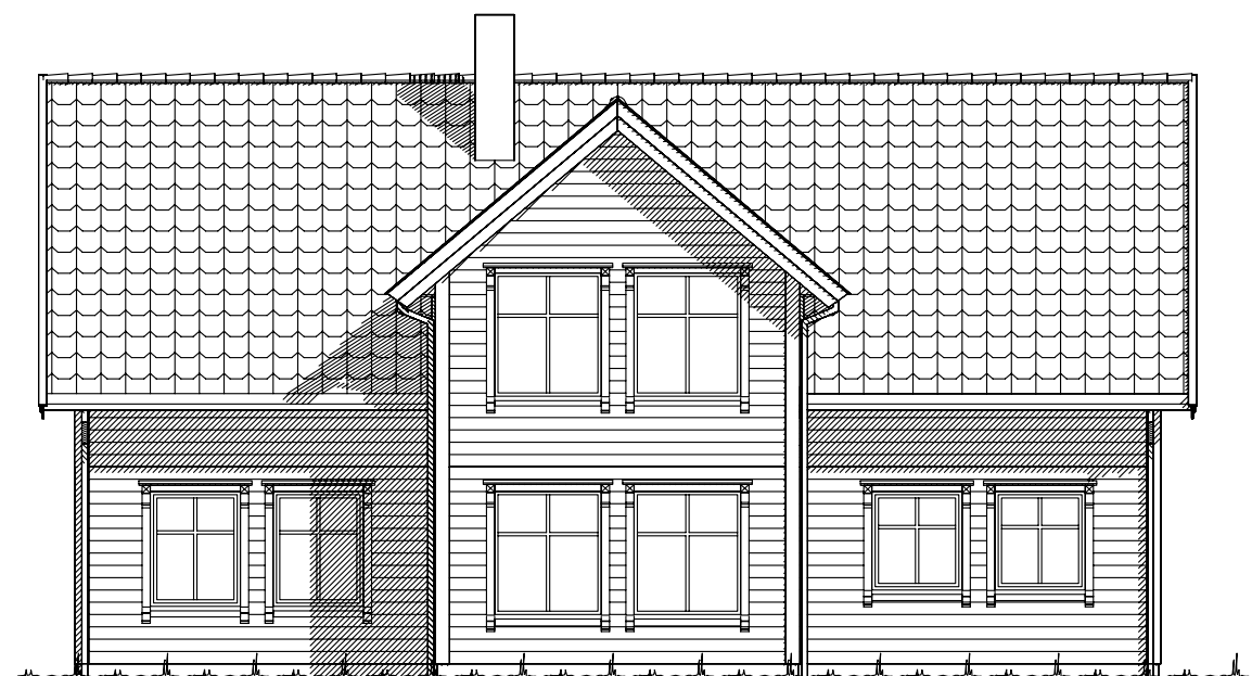
Fasade mot .