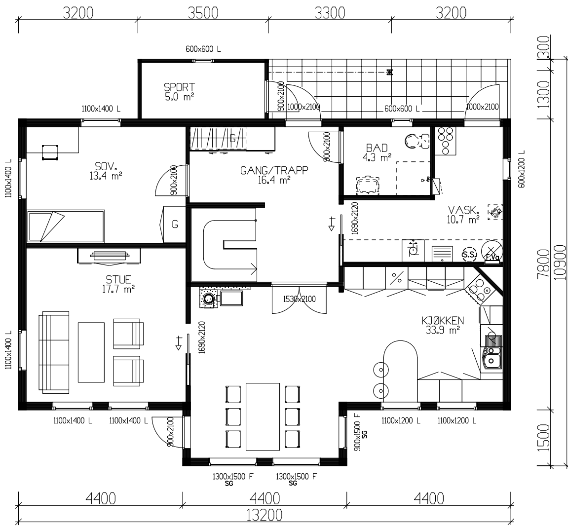
HOVEDETASJE: 100,3m² BRA + SPORT 5,0m²