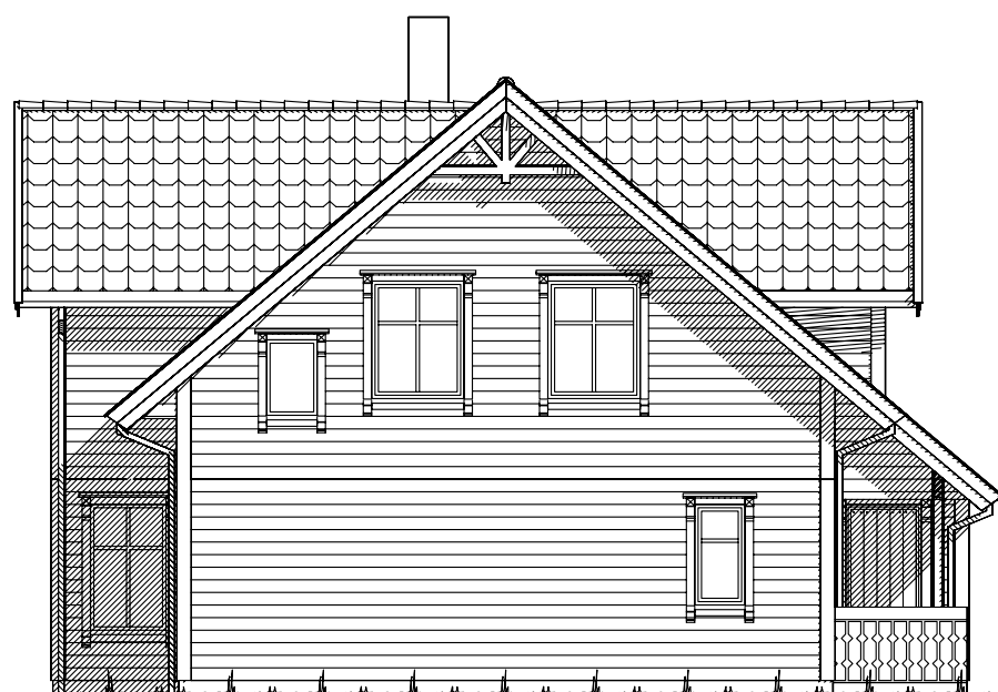
Fasade mot .

Ferdig planert terreng Bak / under terreng Eksisterende terreng